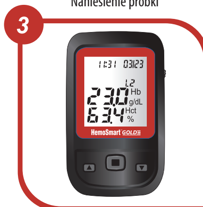
Wyniki w 5 sekund